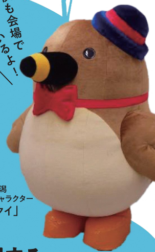
福島潟 マスコットキャラクター 「クイクイ」