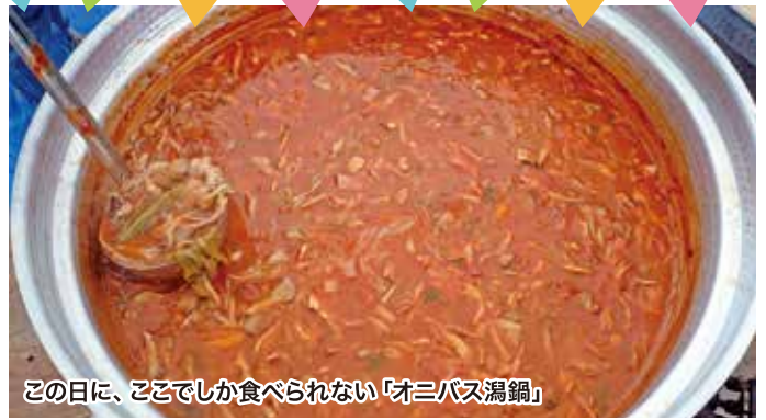
この日に、ここでしか食べられない「オニバス湯鍋」

1戦 11:00~11:40 (受付 10:30~) } 各回30組 2戦 12:00~12:40 (受付 11:45~) 3戦 13:00~13:40 (受付 12:45~)