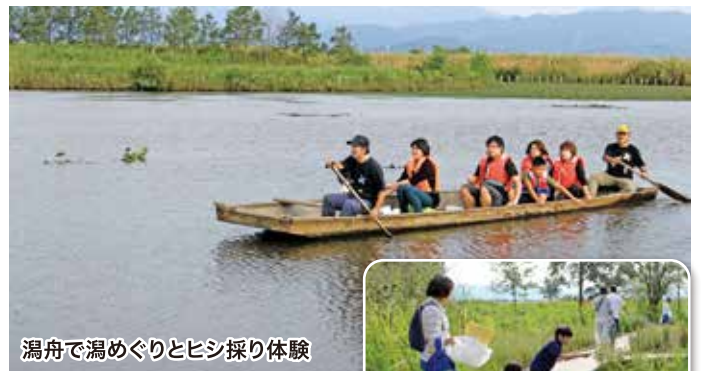
潟舟で潟めぐりとヒシ採り体験

各種ジュースにかき氷、やきそば、フランクフルト、焼鳥、肉串、ラーメン、メロンパン、などなど、様々なメニューが大集合。