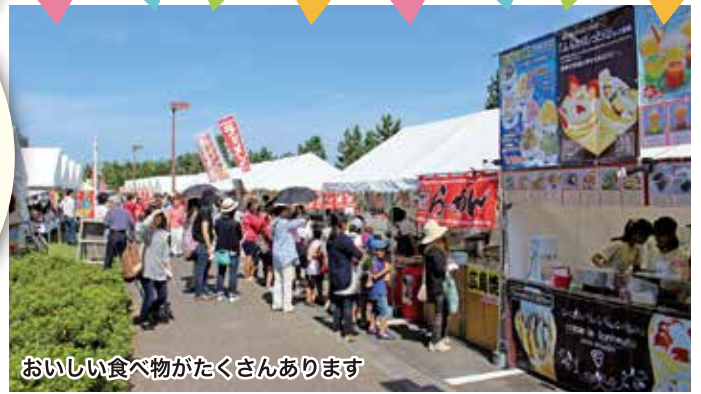
おいしい食べ物がたくさんあります

納豆やクッキー、はちみつやドリップパックなどクローバーの真心のこもった手工芸品をたくさん用意して、皆さまのご来店をお待ちしております。