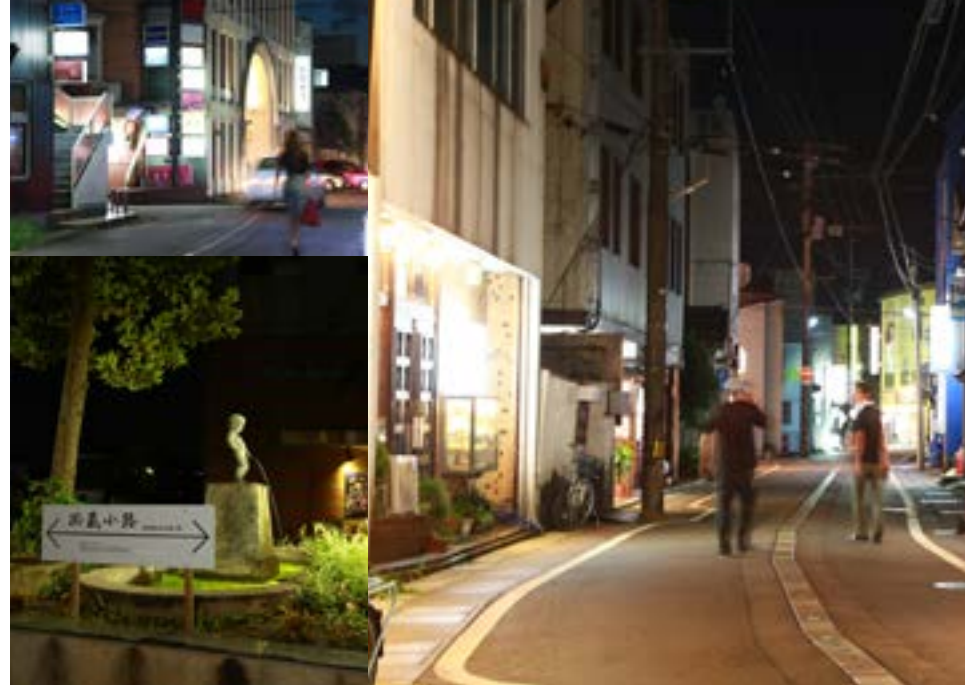
昭和10年の新発田大火で多くが焼失したが、街のあちこちに、当時に思い出す跡が残っている